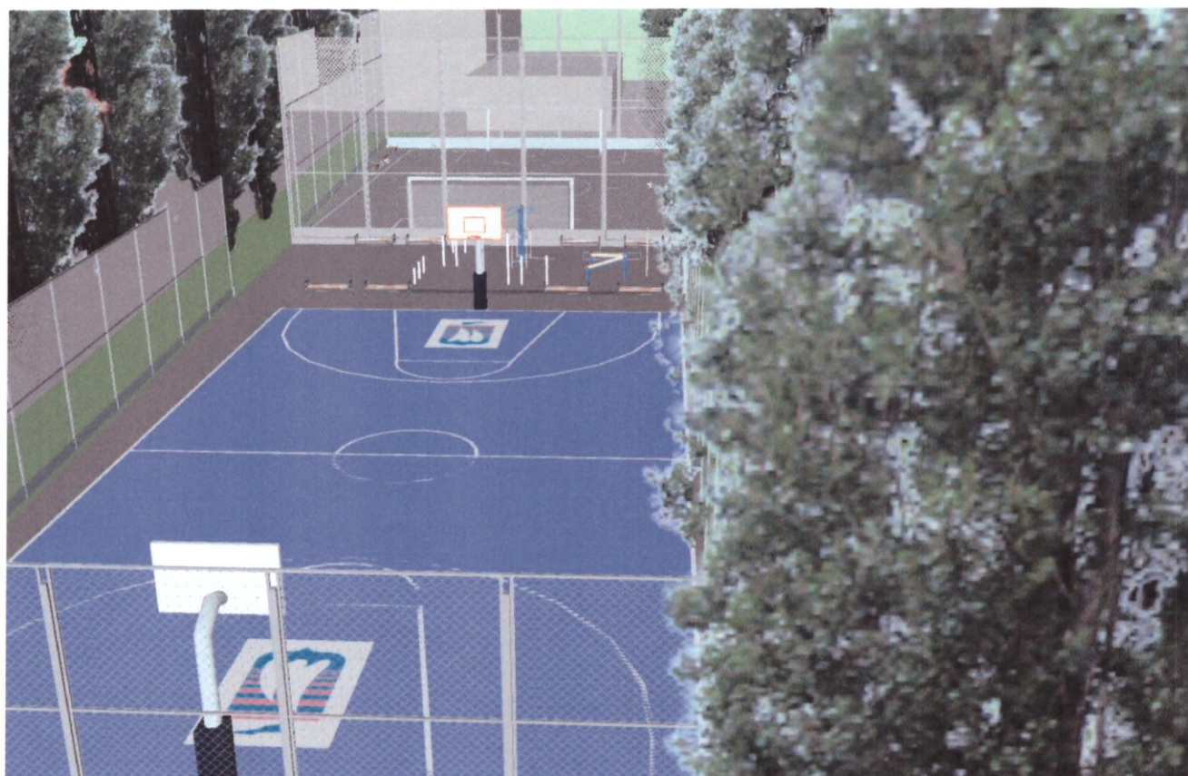
Малюнок дизайну 2