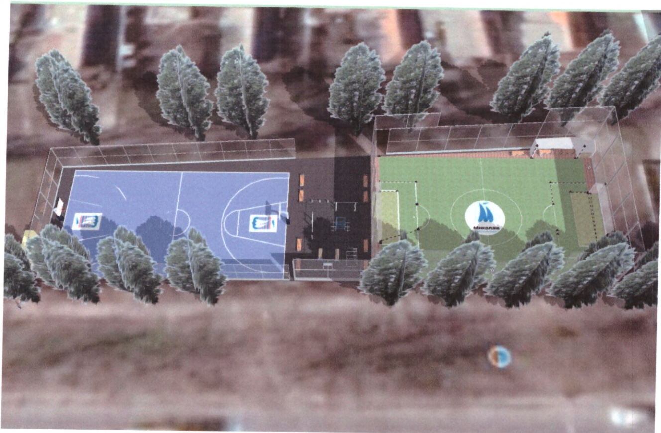
Малюнок дизайну 3