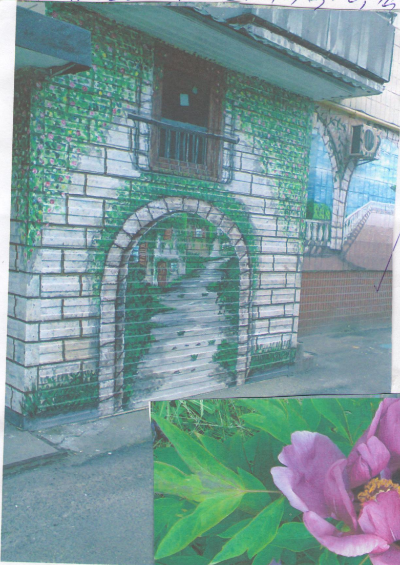
Орієнтовне оздоблення стени.