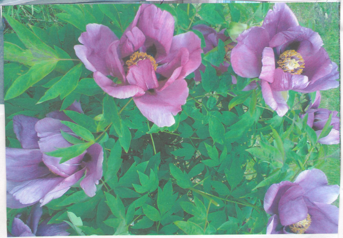
Квіти майбутнього полісаджія.